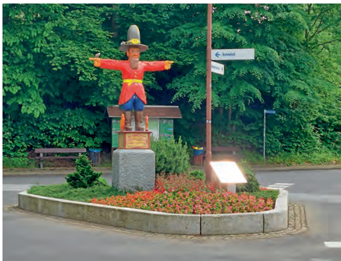
Martin Pumphant ist eine Sagengestalt aus der Oberlausitz. Er soll über große magische Fähigkeiten verfügen. Ein Denkmal für ihn steht in Wilthen.