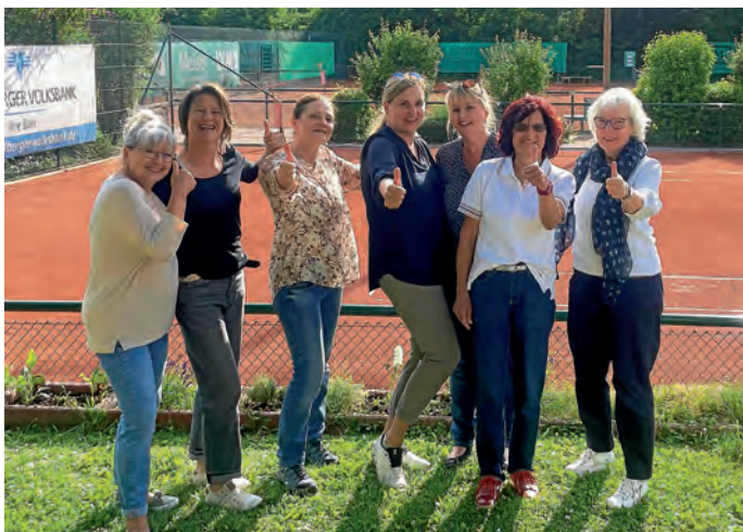
Die Damen 50 nach ihrem Sieg.

In der vergangenen Woche waren von der U9 Kleinfeld bis zu den Herren 70 insgesamt 14 Mannschaften im Einsatz. Die Bilanz war mit 9 Siegen und einem Unentschieden sehr positiv. Erfolgreich abschneiden konnten die U9 Kleinfeld mit 8:0 gegen TC Schwetzingen, U10 Midfeld mit 5:1 gegen TSG Gaiberg/Edingen, U12 mit 4:2 gegen BW Leimen, Herren 1 mit 8:1 gegen TC Sandhausen, Herren 40 mit 3:3 gegen TC Gaiberg, Damen 50 mit 5:4 gegen TV Reilingen, Herren 50 mit 4:2 gegen FC Zuzenhausen, Herren 55 mit 5:4 gegen SKV Sandhofen, Herren 65 mit 6:0 gegen TSG Ladenburg/Ilvesheim, Herren 70 mit 6:0 gegen DJK Feudenheim. Die Spieler der Jugendmannschaft U12 zeigten in Leimen besonderen Teamgeist, indem sie die Aufstellung geschickt wählten und trotz Verletzung und anderen Terminen für die Mannschaft bereitstanden. Vielen Dank an Felix, Alex, Juri und Leo für die außergewöhnliche Unterstützung. Herzlichen Glückwunsch den erfolgreichen Mannschaften!